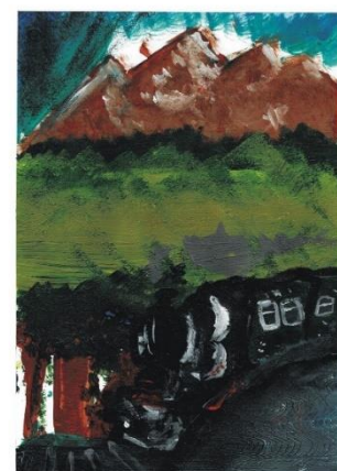
Amiezi cu mocăniță și cu libelule